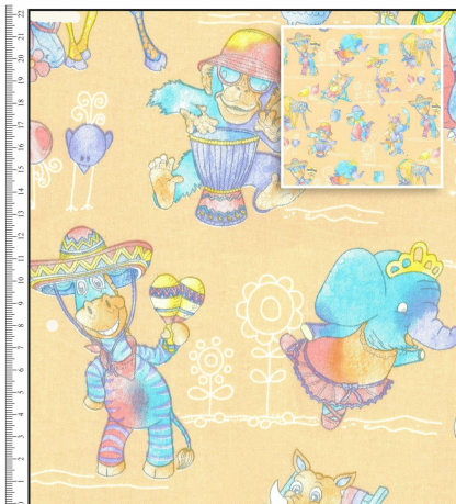
DESIGN: 1XC076904 • 100% COTTON • WIDTH: 150 cm • WEIGHT: 230 gsm REPEAT SIZE - 32 cm x 32 cm

Diese Liste ist natürlich nicht erschöpfend, und es gibt viele andere Nähprojekte, die man aus Kinderstoffen umsetzen kann.