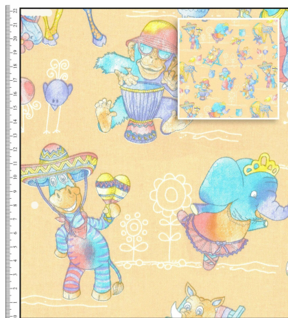
DESIGN: 1XC076904 • 100% COTTON • WIDTH: 150 cm • WEIGHT: 230 gsm REPEAT SIZE - 32 cm x 32 cm

Unsere fair gehandelten Polsterstoffe bzw. Bezugsstoffe sind reinen Naturfasern. Beispielsweise aus 100% Baumwolle, oder Baumwolle mit Leinen-Anteil. Sie sind besonders strapazierfähig und geeignet als Polsterstoff für neue Sofas, Stühle, Sessel, als Bezugsstoff für Sitzkissen, uvm.