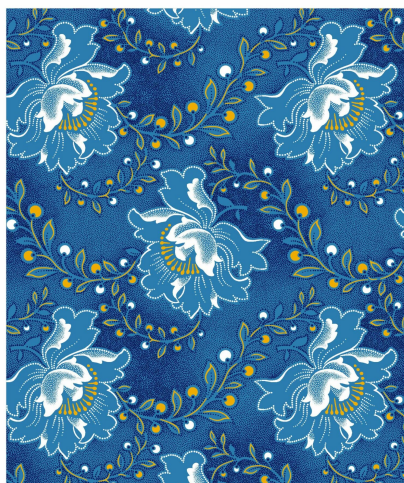
DESIGN: 1H1288 272 100% COTTON • WIDTH: 89/90 CM

Südafrikanische Baumwollstoffe mit sogenanntem „Blue Print“ Kupferrollendruck