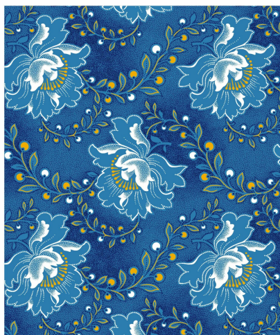
DESIGN: 1H1288 272 100% COTTON • WIDTH: 89/90 CM