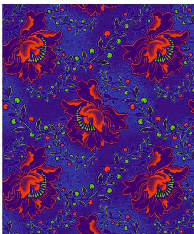
DESIGN: 1H1288 301 100% COTTON • WIDTH: 89/90 CM