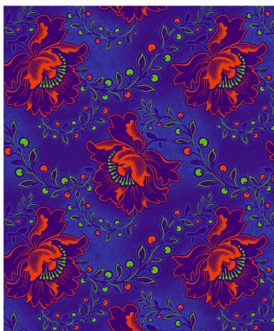
DESIGN: 1H1288 301 100% COTTON • WIDTH: 89/90 CM