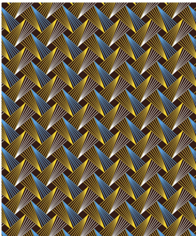
DESIGN: 1H1289 711 100% COTTON • WIDTH: 89/90 CM

Südafrikanische Baumwollstoffe mit sogenanntem „Blue Print“ Kupferrollendruck