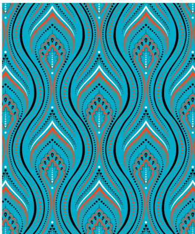
DESIGN: 1H1292 251 100% COTTON • WIDTH: 89/90 CM

Südafrikanische Baumwollstoffe mit sogenanntem „Blue Print“ Kupferrollendruck