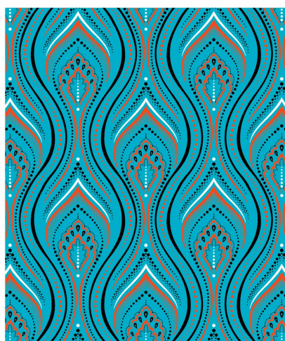
DESIGN: 1H1292 251 100% COTTON • WIDTH: 89/90 CM

Südafrikanische Baumwollstoffe mit sogenanntem „Blue Print“ Kupferrollendruck