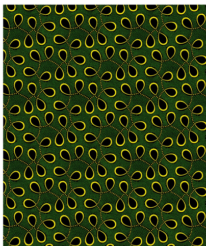
DESIGN: 1H1596 19 100% COTTON • WIDTH: 89/90 CM

Südafrikanische Baumwollstoffe mit sogenanntem „Blue Print“ Kupferrollendruck